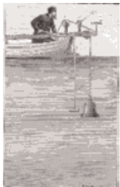
Fig 1 : expérience de colladon d'un dispositif qui permet l'émission des signaux acoustiques et visuels

Jeu sonore radiophonique (Hörspiel) proposé par Jean-Loup Graton en hommage à notre planète en péril : à écouter sous l'eau, comme il se doit.