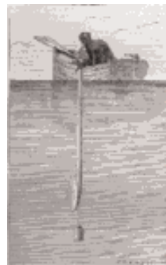
Fig 2 : expérience de colladon D. Colladon, après avoir enclenché son chronomètre, se met à l'écoute du signal acoustique

Jean-Loup Graton propose dans Le chant des baleines un parcours photographique des cris d'appels et des cris amoureux de différentes espèces de cétacés : baleines bleues, cachalots, dauphins. Dérives aquatiques nous amène des sons naturels et animaliers du chant des baleines vers un environnement sonore plus abstrait, un jeu sonore où sons électroniques et sons naturels se rencontrent.